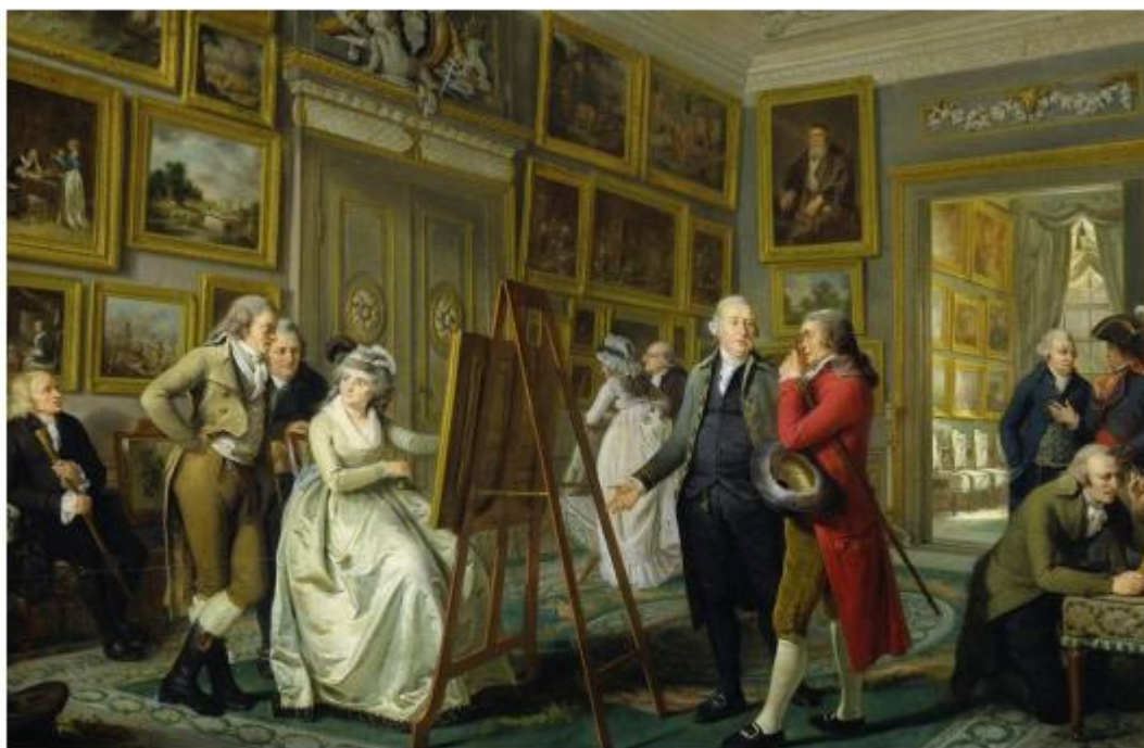
2-rasm. Adrian de Leli "Qirollik akademiyasi" 1794-95