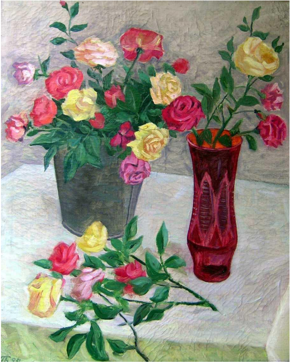
B.Tojiev. "Atirgullar" natyurmort