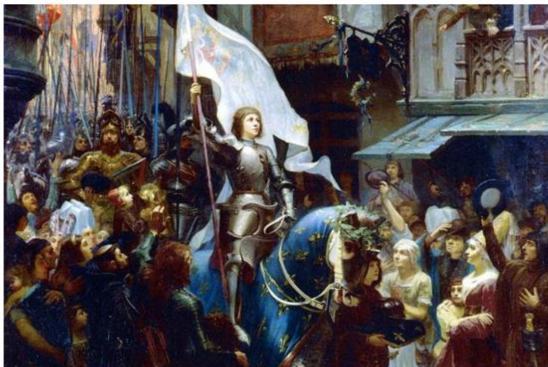
I-rasm. Yan-Jak Shiring "Jan Darkni inglizlarga qarshi yurishi" 1887 y.

Akademik san`at yoki akademizm - bu Yevropa san`at akademiyalari ta`sirida yozilgan asar, haykaltaroshlik va arxitektura uslubi. Aniqrog`i, akademik rangtasvir san`at bu neoklassik va romantik oqimlar doirasida amalda bo`lgan Fransiya Tasviriy san`at akademiyasi me`yorlari ta`sirida bo`lgan san`at va rassomlar hamda bu ikki harakatdan keyin ularning har ikkala uslublarini sintez qilishga urinishida paydo bo`lgan san`atdir. Uilyam-Adolf Bugero, Tomas Kuture va Xans Makart asarlarida eng yaxshi aks ettirilgan. Shu nuqtai nazardan, u ko`pincha "akademizm", "badiiy dabdaba" (pejorativ tarzda) va "eklektizm" deb ataladi va ba`zan "tarixiylik" va "sinkretizm" bilan bog`lanadi. Akademik rangtasvir san`at Evropa akademiyalari ta`sirida yaratilgan rasm va haykaltaroshlikni o`z ichiga oladi, bu davrda ko`plab rassomlar rasmiy ta`lim olgan. Akademik rangtasvir san`at asosan adabiy, mifologik va tarixiy asosli, maqbul yoki kerakli mavzularning kanoniga sodiqdir. Uning rassomlari oddiy yoki oddiy narsalarni tasvirlashga qiziqish bildirmadilar. Akademik rangtasvir san`at realistik emas, idealistikdir.