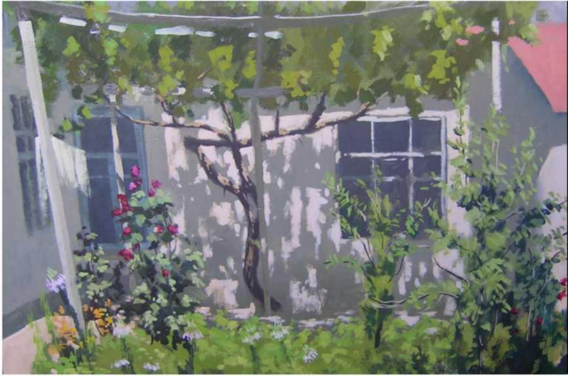
N. Abdusalomxo'jaev. "Xovli"