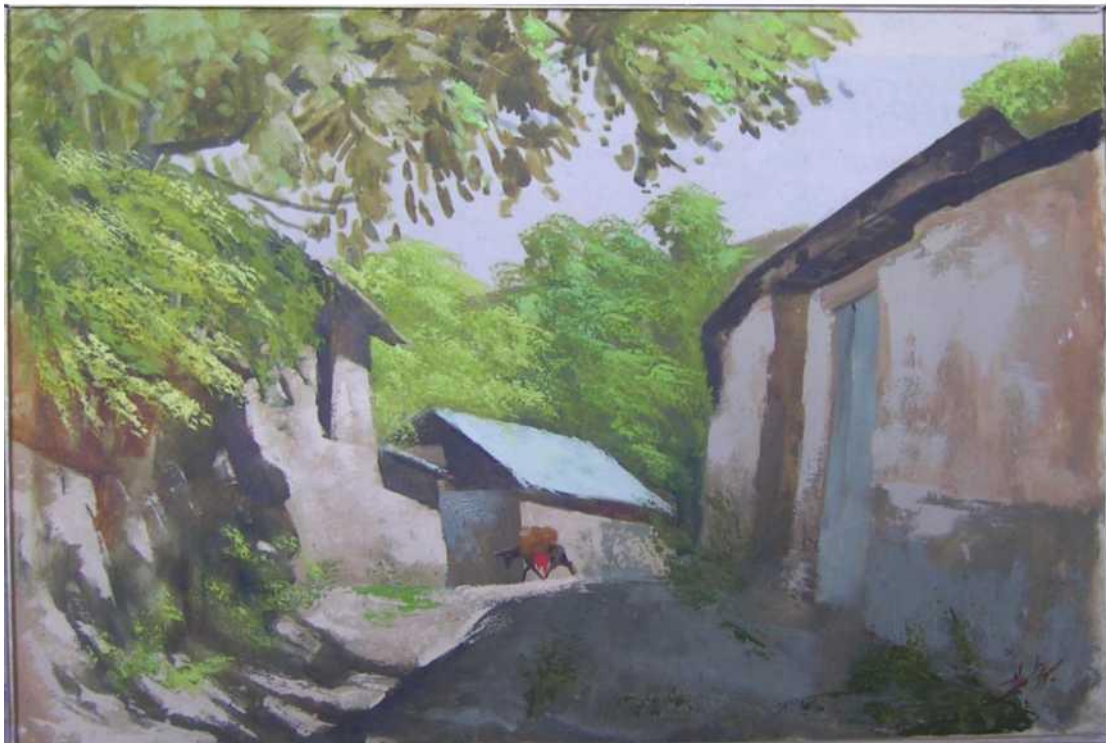
N. Abdusalomxo'jaev. "Xumson qishlog'i"