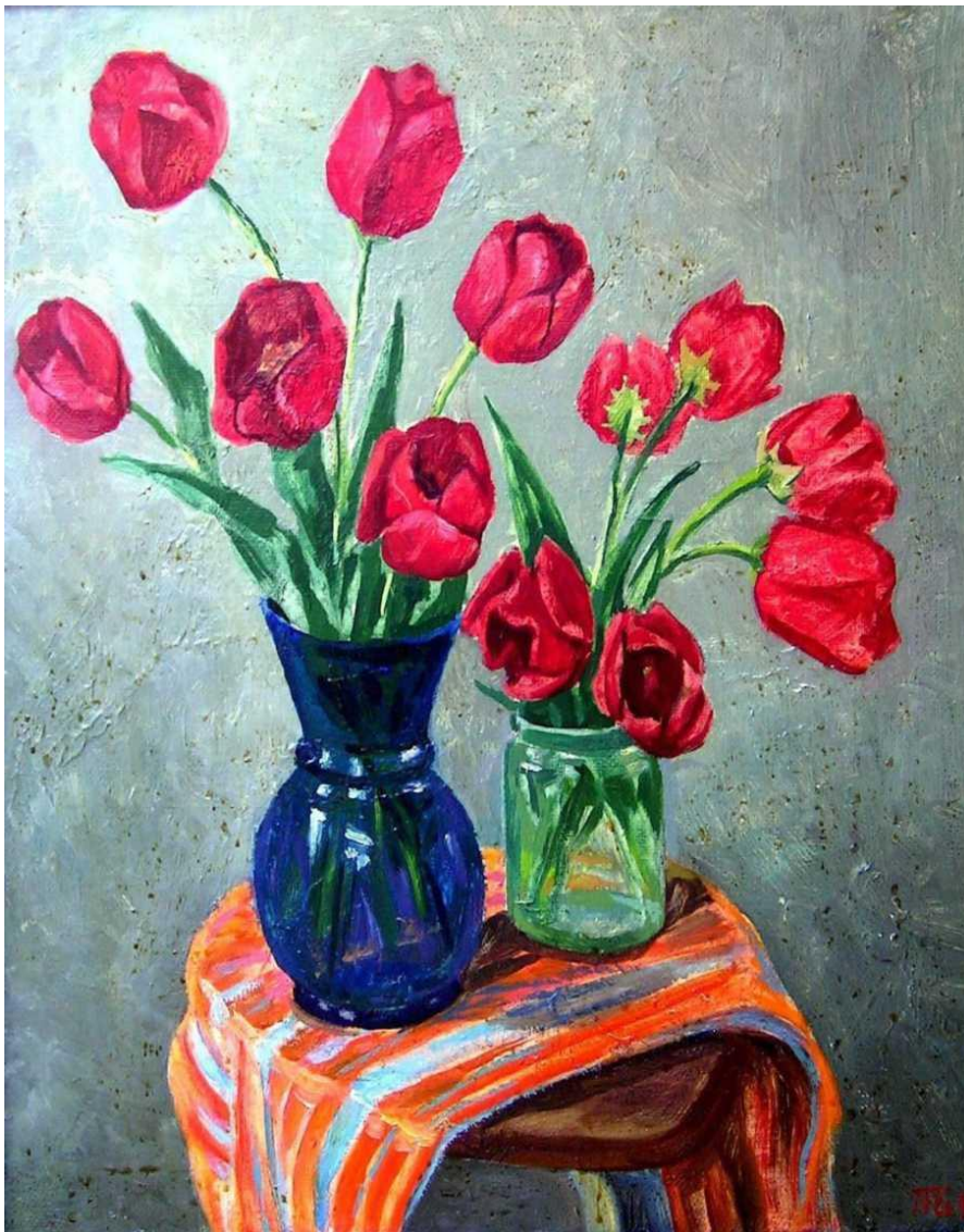
B. Tojiev. "Baxor lolalari"

Moybo'yoqda tasvirlar ishlashning juda ko'p o'rganilishi kerak bo'lgan tomonlari bor. Ularning barchasi ko'p mashq qilish orqali o'rganib olish imkonini beradi. Tajriba nazariy va amaliy tomondan muntazam mashq qilish natijasida oshadi. Bunda maxsus adabiyotlarni mutolaa qilish ham yaxshi yordam beruvchi vositadir.